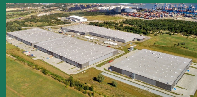
DSV – duńskie przedsiębiorstwo logistyczne Gdańsk, Sosnowiec – 34 900 m 2