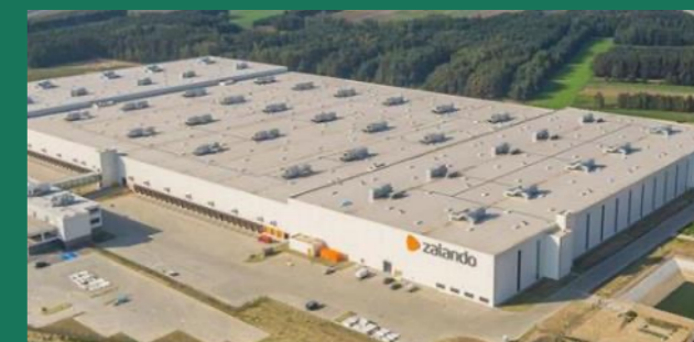
Zalando – największy e-sklep z modą w Europie Głuchów, Szczecin – 202 000 m 2