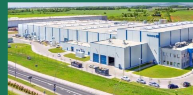
Gestamp – wiodący producent części do aut Wrocław – 33 000 m 2