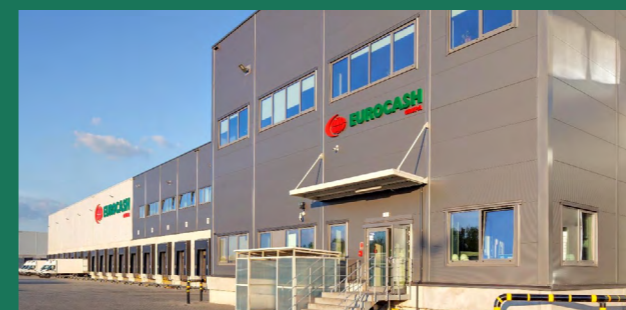
Eurocash – lider na rynku dystrybucji FMCG Gdańsk, Kraków, Sosnowiec – 72 400 m 2