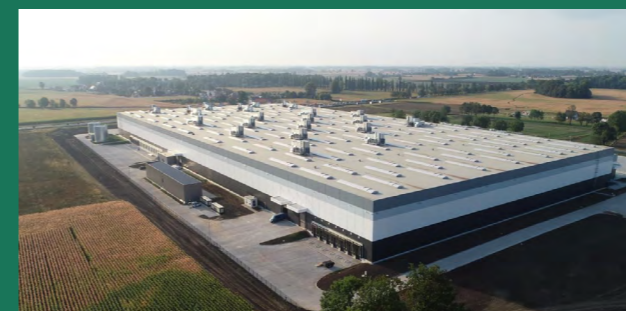
The Hut Group – brytyjski lider e-commerce Wrocław – 61 800 m 2