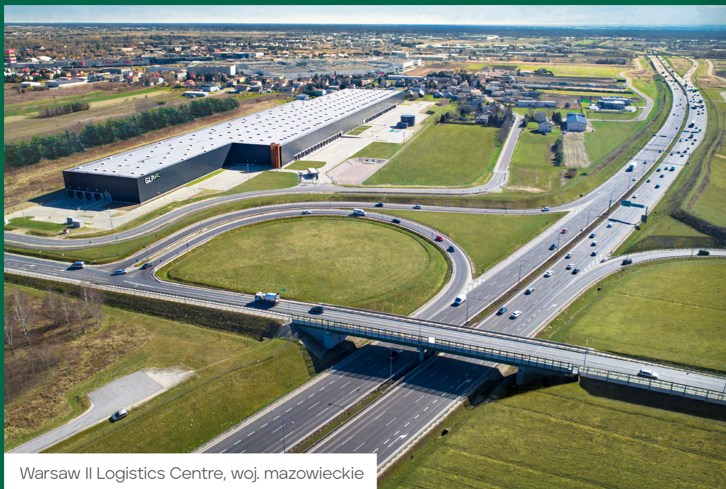
Warsaw II Logistics Centre, woj. mazowieckie

Magazyny to najbardziej dynamicznie rozwijająca się część rynku nieruchomości. Centra logistyczne naturalnie przyciągają kolejnych inwestorów i stają się ośrodkami rozwoju biznesu. Widzimy potencjał miejsc, w których budujemy nasze projekty. Dlatego inwestujemy nie tylko we własne budynki, lecz także infrastrukturę, która pozwala rozwinąć się całej okolicy.