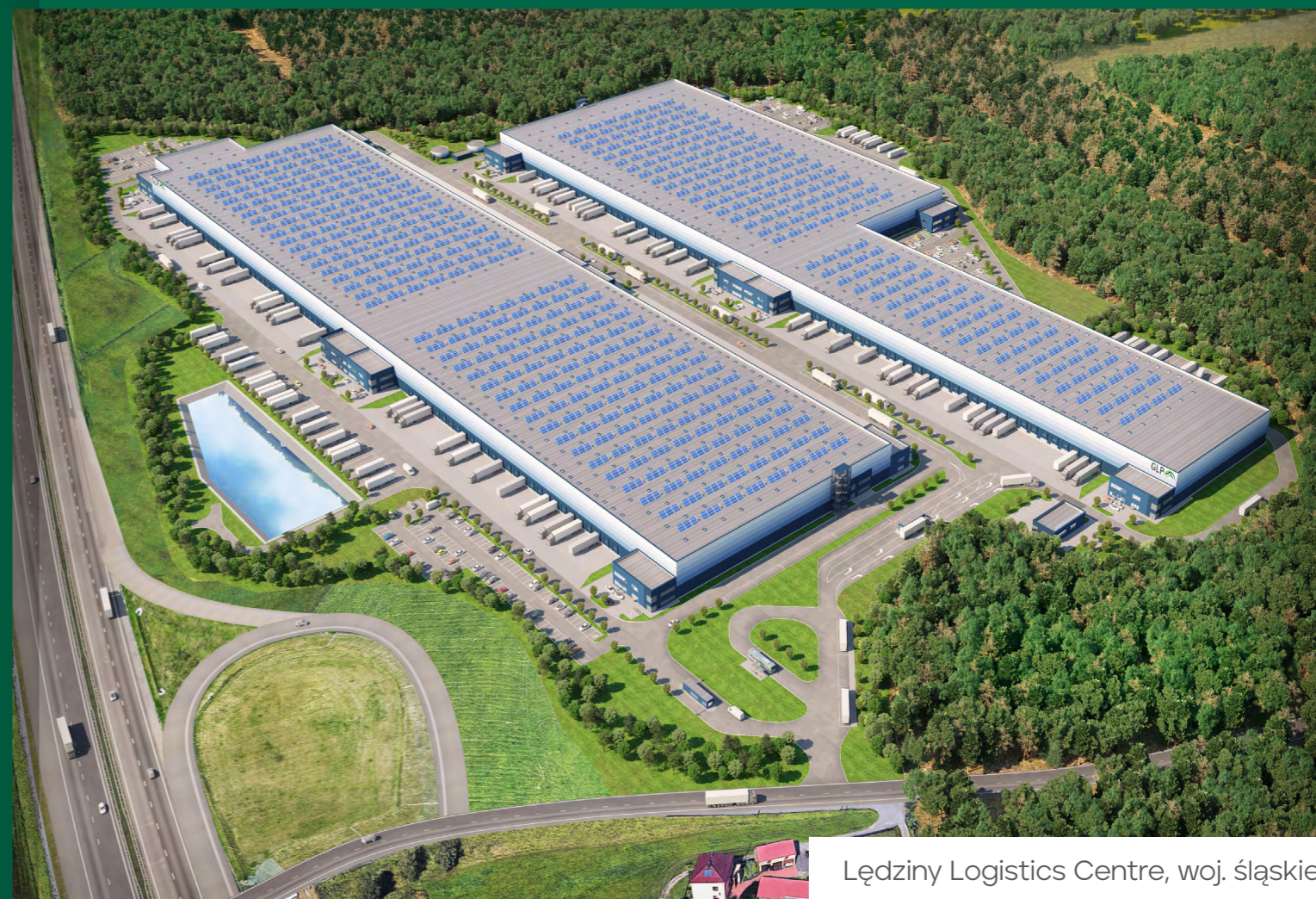
Lędziny Logistics Centre, woj. śląskie

Jesteśmy jednym z największych na świecie inwestorów i deweloperów nieruchomości logistycznych.