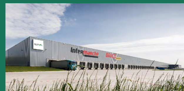
Intermarché – francuska sieć supermarketów Poznań – 85 200 m 2