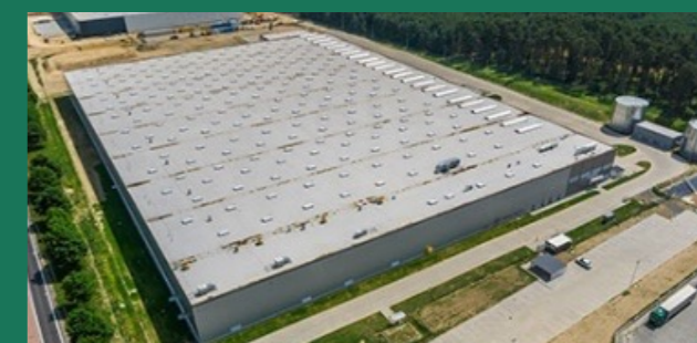
BMW – producent wysokiej jakości samochodów Świecko – 32 000 m 2